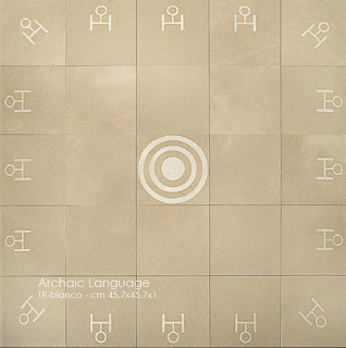
Archaic Language TR-bianco - cm 45.7x45.7x1

Sintetizzando e astruendo graficamente il tipico muro antico di pietre a « opus incertum » abbiamo ottenuto una superficie/racconto mediterraneo molto espressivo ed elegante che accoglie i giochi della luce con i suoi diversi livelli. Abbiamo « graficizzato » la tecnica della macchia aperta speculare delle venature della pietra (open book) ottenendo così delle superfici espressive e armoniose nello sviluppo del loro disegno generale.