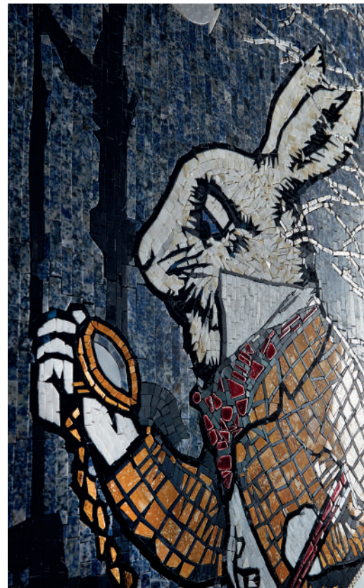
WONDERLAND COLLECTION - FABULOUS DETTAGLI / DETAILS