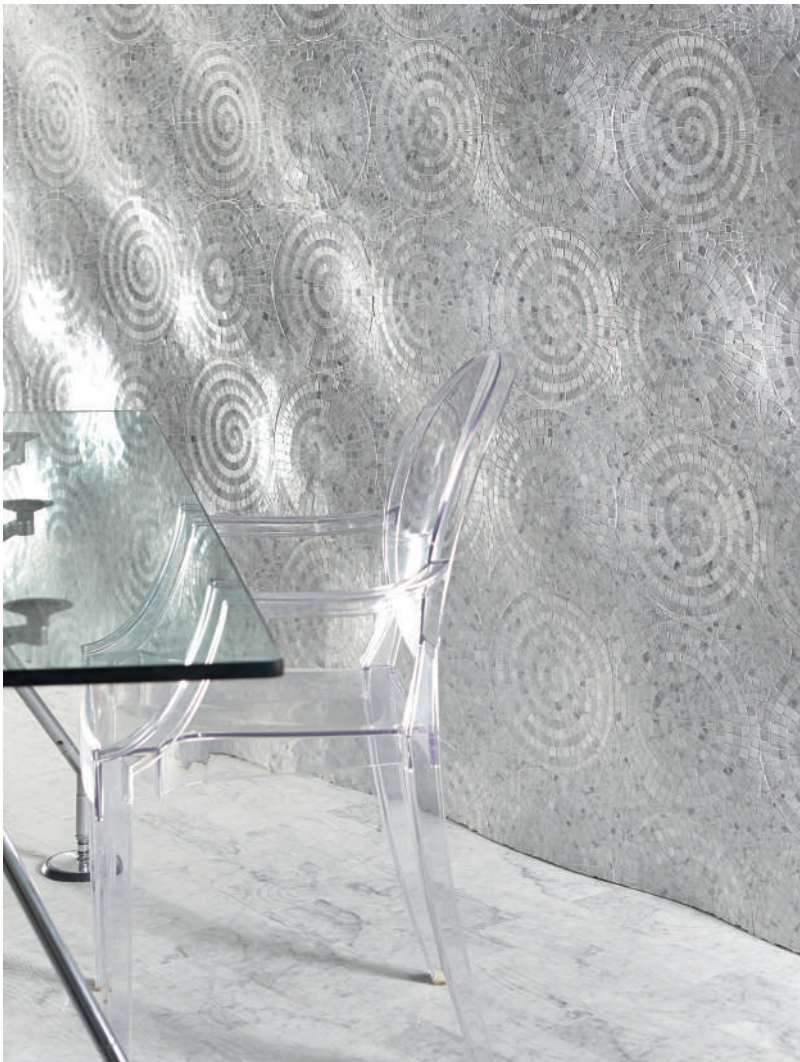
OP' LAND COLLECTION - WALL DETTAGLI / DETAILS