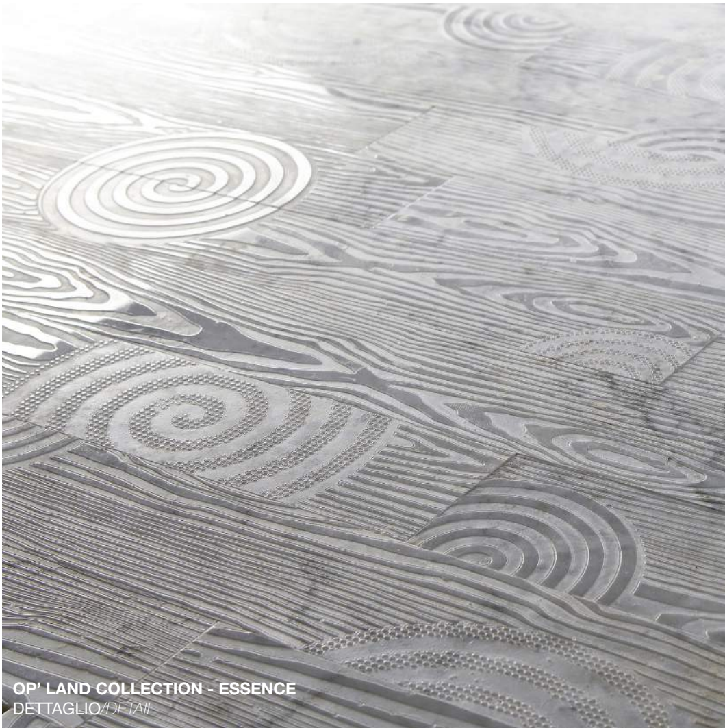
OP' LAND COLLECTION - ESSENCE DETTAGLIO/DETAIL