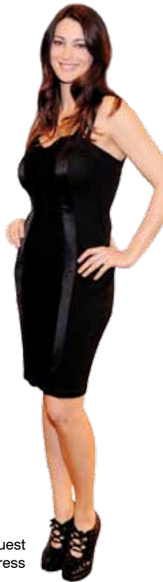
IGV event Special Guest Manuela Arcuri | Italian actress