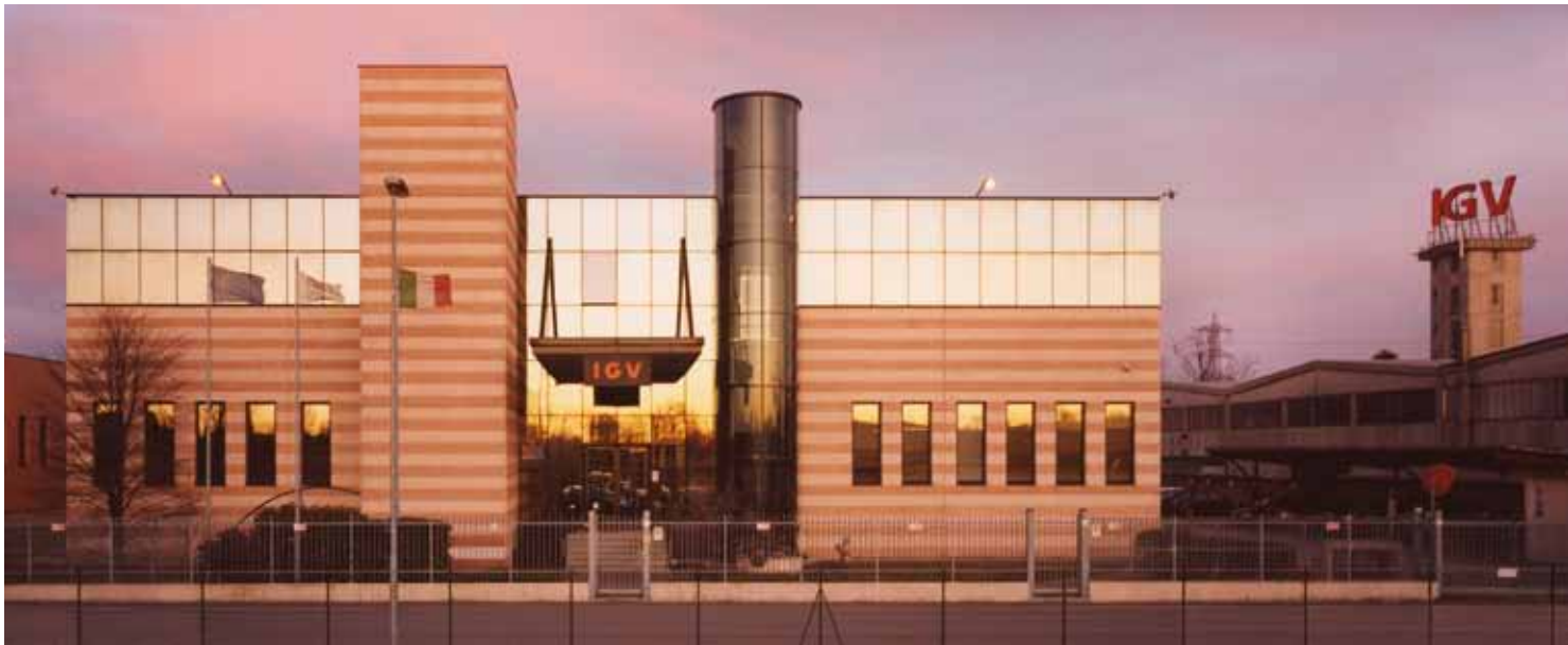
IGV Group Vignate - Milan | Italy